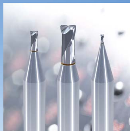
Torusfräser zum Prozesssicheren Fräsen innerhalb 10\ \mu\text{m} in der Großserienproduktion Torus end mills for process-safe milling with 10\ \mu\text{m} in large batch production