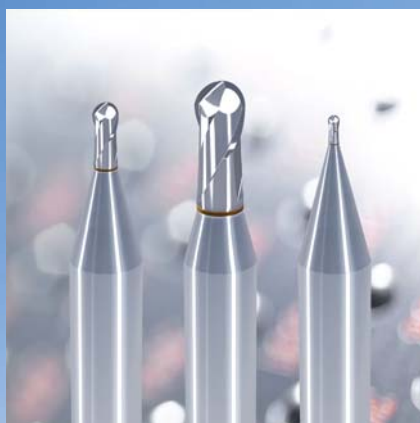
Höchstpräzise Radiusfräser zum HSC-Fräsen von harten Werkstoffen bis HRC 65 Ultra-precise ball nose end mills for HSC milling of hard materials up to HRC 65

Alle Werkzeuge werden nach jedem Fertigungsschritt mit Messmaschinen der neuesten Generation computergesteuert vermessen. So können wir garantieren, dass alle ZECHA-Werkzeuge auch anspruchsvollste Anforderungen erfüllen.